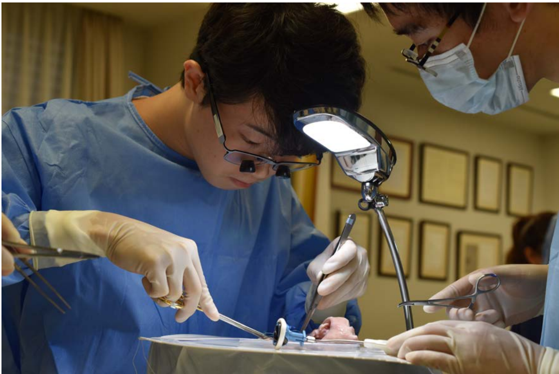
熱心な指導の下、初めての手技に試行錯誤しながら、一生懸命練習しました