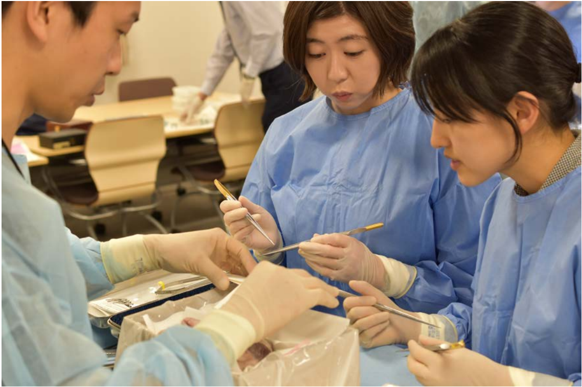
青山先生による冠動脈吻合の指導